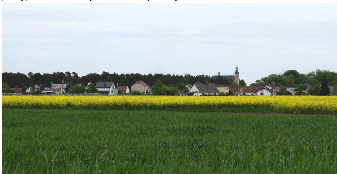
Widok na istniejącą zabudowę miejscowości Szymiszów - Wieś.

W obrębie dominują tereny leśne i rolnicze. Tereny leśne zajmują około 39% obszaru opracowania i sąsiadują z terenami rolniczymi i zabudowanymi miejscowości.