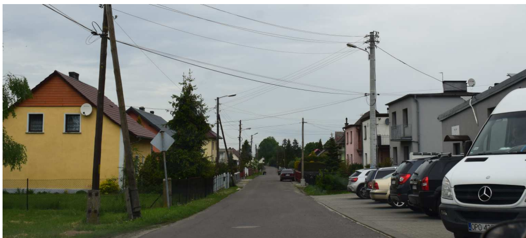
Ul. Piękna w Szymiszowie Osiedlu. Widoczna współczesna zabudowa mieszkaniowa jednorodzinna.

Oceniając zmiany w krajobrazie wiejskim, należy uznać, że w części został on już przekształcony. W zabudowie historycznej rażąca jest przebudowa budynków historycznych – na pudełkowe, modernistyczne oraz lokalizowanie współczesnych budynków również w formie pudełkowej. Również niektóre współczesne budynki rolnicze gospodarcze i inwentarskie negatywnie oddziałują na środowisko kulturowe. Szczególnie rażące są budynki z płaskimi dachami, napowietrzne linie elektroenergetyczne. Zaletą krajobrazu kulturowego wsi jest ograniczona wysokość współczesnej zabudowy, przez co nie dominuje ona w krajobrazie nad zwartą wiejską zabudową, wyposażenie dróg w chodniki, uporządkowane i jednolite ogrodzenia nieruchomości.