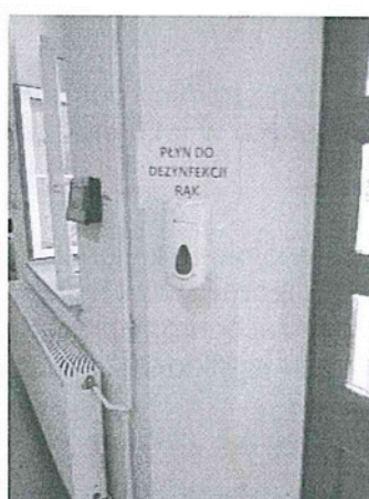
Fotografia nr 4