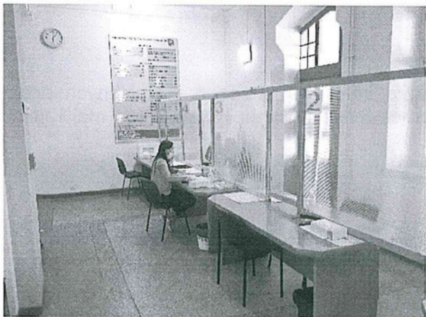
Fotografia nr 1

przymocowanym do ściany dozowniku jest oznaczony jaką substancją zawiera. Pracodawca przedstawił karty charakterystyki dla wyżej wymienionego płynu w dniu 25.08.2020r. W czasie kontroli nie stwierdzono aby interesanci przebywali na terenie urzędu bez maseczek ani nie stwierdzono aby takie osoby były obsługiwane przez pracowników. W dniu kontroli okazano ogłoszenie, w którym w celu ograniczenia liczby interesantów, mogących być potencjalnym źródłem zakażenia ograniczono ilość równocześnie obsługiwanych osób. Powyższa informacja została umieszczona na drzwiach wejściowych do urzędu na parterze – napis „proszę wchodzić pojedynczo”