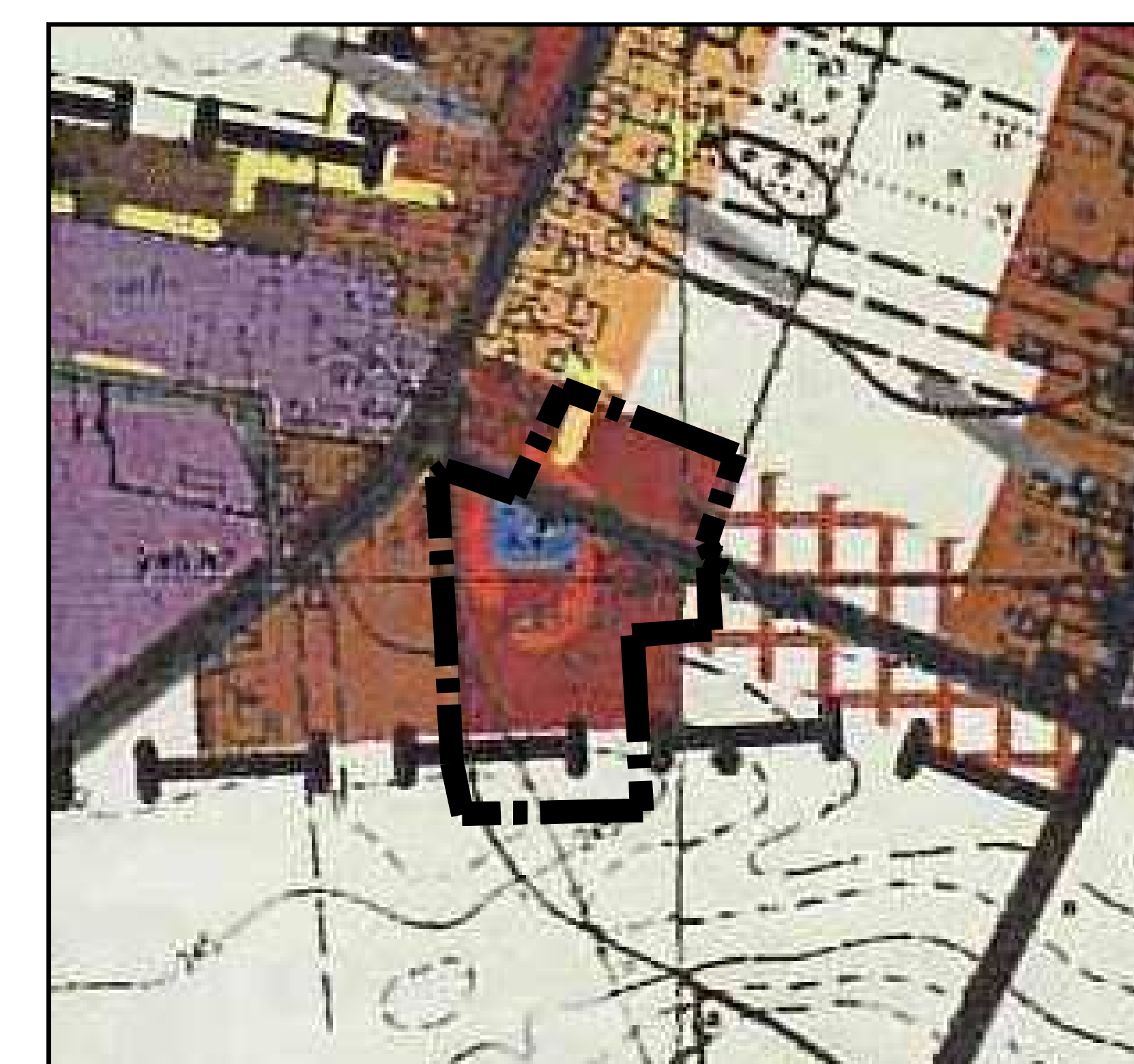
WYRYS ZE STUDIUM UWARUNKOWAŃ I KIERUNKÓW ZAGOSPODAROWANIA PRZESTRZENNEGO GMINY STRZELCE OPOLSKIE (PRZYJĘTE UCHWAŁĄ NR XXIX/251/08 Z DNIA 22 GRUDNIA 2008 R.)