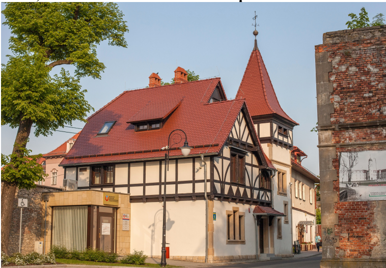
Zdjęcie nr 36. Willa, ul. Zamkowa 4 w Strzelcach Opolskich, źródło: Urząd Miejski w Strzelcach Opolskich