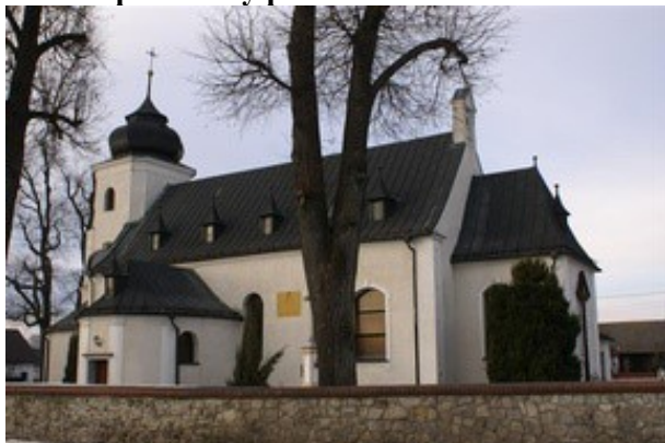
Zdjęcie nr 12. Kościół parafialny pw. św. Michała Archanioła w Rozmierzy

Zbudowany w XV w., powiększony w XVIII w., rozbudowany w 1900 r. Kościół jednonawowy, z węższym i niższym prezbiterium, z wieżą w fasadzie zwieńczonej splotami wolutowymi oraz z aneksami zakrystii i kruchty pld. Z XV - wiecznego kościoła zachowane częściowo mury nawy i zakrystii oraz wieża od zach. Obecny wygląd kościół zawdzięcza barokowej przebudowie.