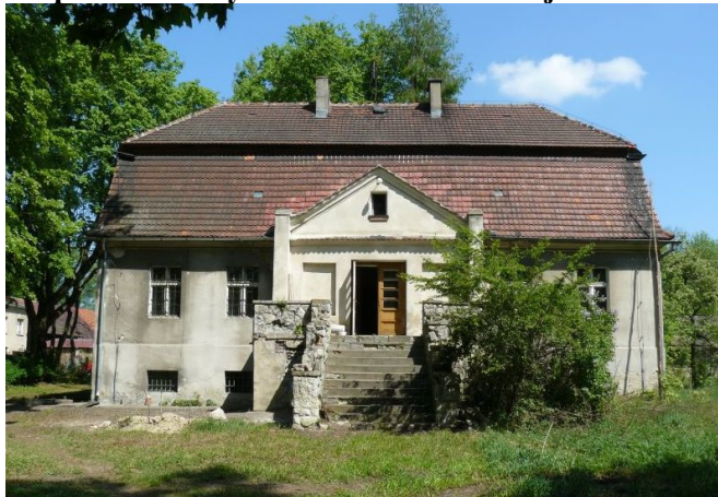
Zdjęcie nr 8. Dwór w zespole zabudowy dworsko - folwarcznej w Kadłubie, ul. Wodna 11

Wpis do rejestru zabytków dotyczy tzw. starego dworu (zameczku myśliwskiego wymienianego w 1845 r.), należącego do rodu von Strachwitz. W związku z budową nowego dworu (ul. Zamkowa 5, ob. Zespół Szkół Specjalnych przy DPS Zgromadzenia Sióstr Franciszkanek Misjonarek Maryi w Kadłubie) po drugiej stronie rzeki Jemielnica w 1930 r., budynek został przekazany nadleśnictwu, po wojnie pełniąc funkcje przedszkola. Obecnie pełni funkcje mieszkalne.