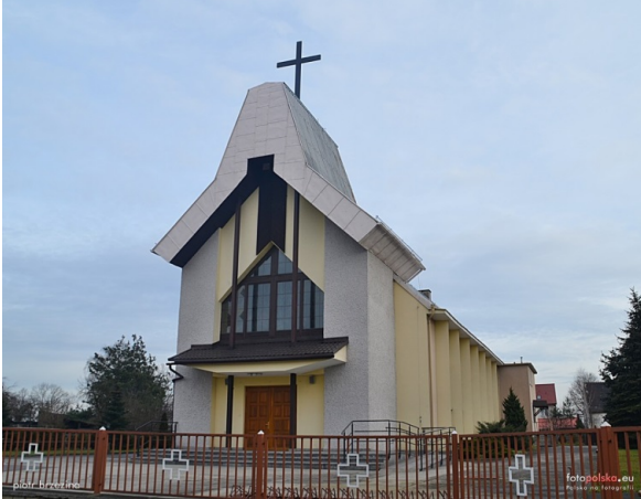
Zdjęcie nr 21. Kościół pw. Najświętszego Serca Pana Jezusa w Rozmierce

Budynek wzniesiony w latach 1980 - 1982.