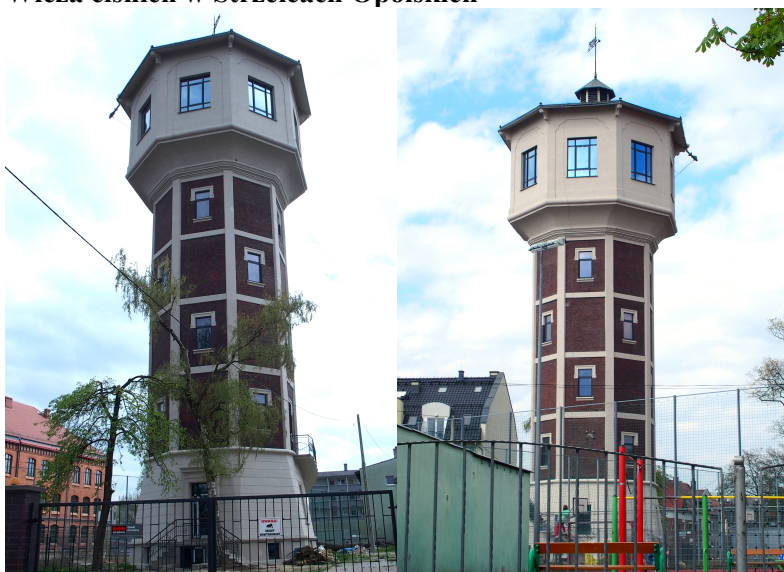
Zdjęcia nr 42,43. Wieża ciśnień w Strzelcach Opolskich