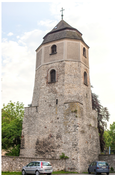
Zdjęcie nr 31, 32. Mury obronne w Strzelcach Opolskich (zdjęcie nr 31 źródło: Urząd Miejski w Strzelcach Opolskich)

Reprezentowane jest przez pozostałości murów obronnych miasta Strzelce Opolskie, wzmiankowanych w 1327 r., zachowały się przy ul. Opolskiej, wzdłuż ul. Kościuszki, gdzie stanowią część kościelnego ogrodzenia, i parku. Wzniesione z kamienia wapiennego, miejscowo umocnione potężnymi szkarpami. Zachowała się także dawna baszta obronna w pobliżu kościoła parafialnego, wmurowana z kamienia w XV w., a na przełomie XVII/XVIII w. - przebudowana na dzwonnice, z górną kondygnacją ceglana. Ważnym elementem systemu obronnego miasta był zamek zintegrowany z pierścieniem murów obronnych. Relikty pierwotnego założenia odnaleźć można w dobrze zachowanym budynku bramnym. Rozpoczęte w 2010 r. prace nad odbudową zamku w Strzelcach Opolskich, prowadzone pod nadzorem konserwatora, są kontynuowane. Umocniono jedynie fundamenty i odrestaurowano wieżę.