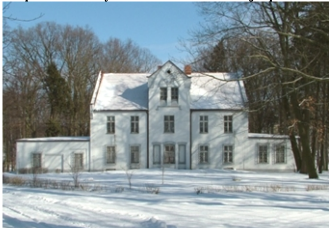
Zdjęcie nr 6. Dwór w zespole zabudowy dworsko - folwarcznej z parkiem w Płużnicy Wielkiej

Dwór wzniesiony w 1 poł. XIX w., po II wojnie światowej użytkowany jako mieszkania pracowników PGR - u zlokalizowanego na terenie folwarku. Obecnie zabytek jest własnością prywatną. Budynek dworu wzniesiony jest na rzucie prostokąta, dwukondygnacyjny z trójkondygnacyjnymi ryzalitami - na osi elewacji dłuższych, z dwoma parterowymi skrzydłami. Korpus nakryty dachem dwuspadowym, skrzydła nakryte płasko. Budynek po remoncie częściowo zmieniającym układ otworów okiennych. Zachowane taśmowe opaski okienne.