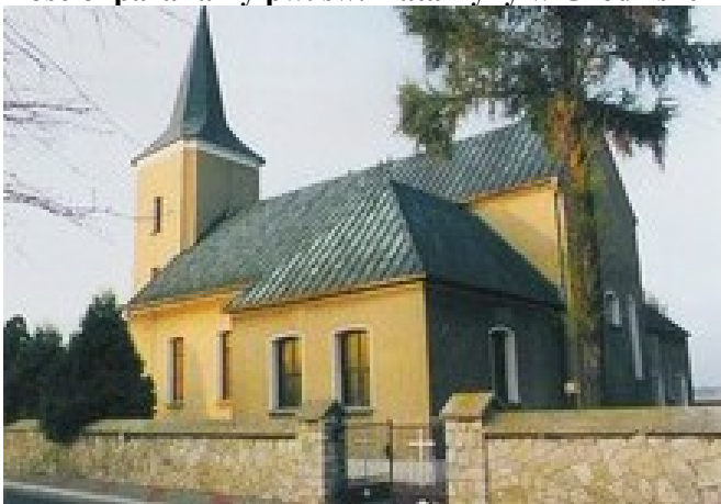
Zdjęcie nr 18. Kościół parafialny pw. św. Katarzyny w Grodzisku