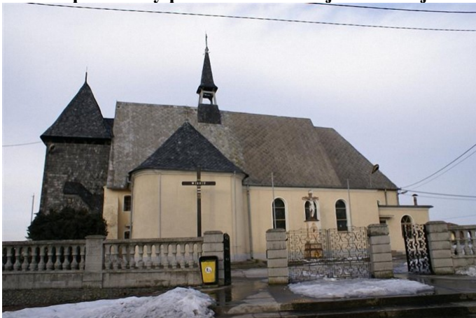
Zdjęcie nr 17. Kościół parafialny pw. św. Bartłomieja w Suchej