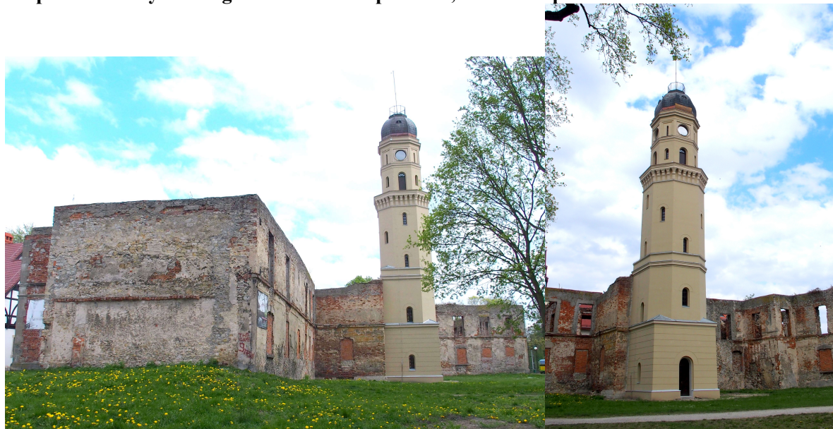
Zdjęcie nr 2, 3. Zespół zabudowy dawnego zamku wraz z parkiem, Strzelce Opolskie

Zamek wzniesiony w miejscu lokalizacji grodu wzmiankowanego w 1303 r. książąt opolskich w pocz. XIV w., wzmiankowany w latach 1324 - 1356: niezbyt rozległe założenie otoczone fosą z wieżą mieszkalną z wapienia. W czasie istnienia księstwa strzeleckiego zamek był rezydencją władcy, przebudowany w XV w. W kolejnych latach przekształcony w rezydencję, którą władowały kolejno rody Hohenzollernów (w latach 1562 - 1595 przebudowali warownię na renesansowy pałac), Redern, Collona, Promnitz. Ostatnia przebudowa - w poł. XIX w. przeprowadzona przez hr. Renarda - zlikwidowała pierwotne cechy stylowe budowli. Była to budowla trójskrzydłowa z dziedzińcem, murowana z kamienia i cegły, otynkowana. Pośrodku budowli znajdował się dziedziniec. Późnoklasykistyczna brama wjazdowa pochodzi z 2 poł. XIX w., park założony został w 1832 r. Podczas II wojny światowej zamek został zniszczony. Resztki pierwotnego XIV - wiecznego zamku znajdują się w obecnych ruinach budynku bramnego.