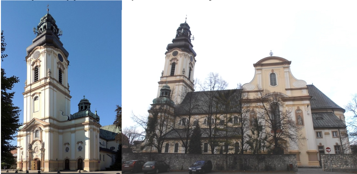
Zdjęcia nr 15, 16. Kościół parafialny pw. św. Wawrzyńca w Strzelcach Opolskich