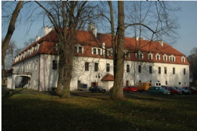
Zdjęcie nr 5. Pałac w zespole zabudowy pałacowo - folwarcznej z parkiem w Szymiszowie

Wczesnobarokowy pałac został wzniesiony ok. poł. XVII w., częściowo przebudowany po zniszczeniach w 1921 r., 1945 r. i adaptacji na Dom Pomocy Społecznej. Budynek na rzucie prostokąta z kwadratowym dziedzińcem wewnętrznym, dwukondygnacyjny, nakryty dachami mansardowymi, w dolnej połaci rozczłonkowanymi gęsto rozmieszczonymi lukarnami. W 2 poł. XVIII w. zamurowano krużganki od strony dziedzińca. Wejście główne poprzedzone czterofilarowym portykiem z tarasem w zwieńczeniu. Wewnątrz przelotowa sień kryta sklepieniem krzyżowo - żebrowym. Elewacje o prostej dekoracji, wokół okien stiukowe opaski, narożniki budynku boniowane.