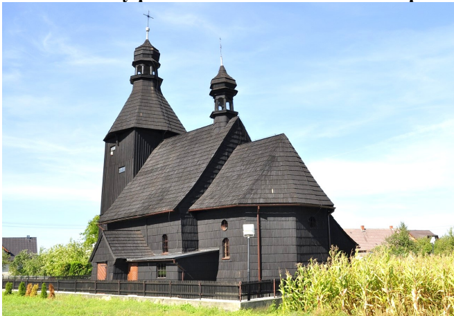
Zdjęcie nr 14. Kościół filialny pw. Nawiedzenia NMP w Szczepanku