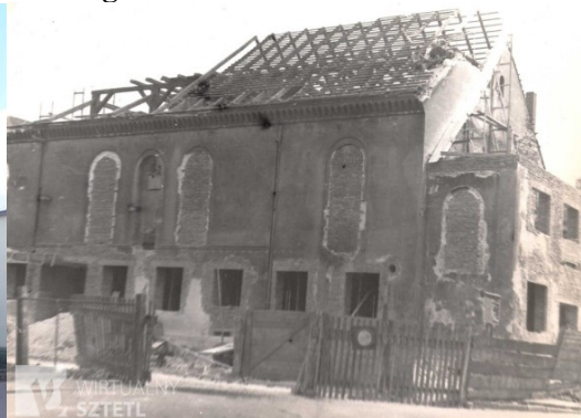
Zdjęcie nr 22, 23. Synagoga w Strzelcach Opolskich, Plac Żeromskiego 5a

Synagoga wzniesiona w 1850 r.: murowany budynek na rzucie prostokąta pierwotnie nakryty dwuspadowym dachem. Aneks ze schodami do babińca - w 1901 r. (mistrz murarski M. Hohmann). Wyposażenie zniszczono 1938 r., po wojnie urządzono w budynku magazyn rolno - spożywczy, w 1976 r. - salę sportową. Przebudowy całkowicie zatępiły dawny wygląd bożnicy. Budynek stracił walory zabytkowe. Społeczność żydowska w historii miasta odegrała istotną rolę w okresie od 1 poł. XVIII w. do 1920 r. Żydzi angażowali się w życie publiczne i towarzyskie miasta, byli wybierani do rady miejskiej. Oprócz synagogi w 2 poł. XIX w. istniała w mieście szkoła żydowska, działała biblioteka, działało w niej wiele stowarzyszeń.