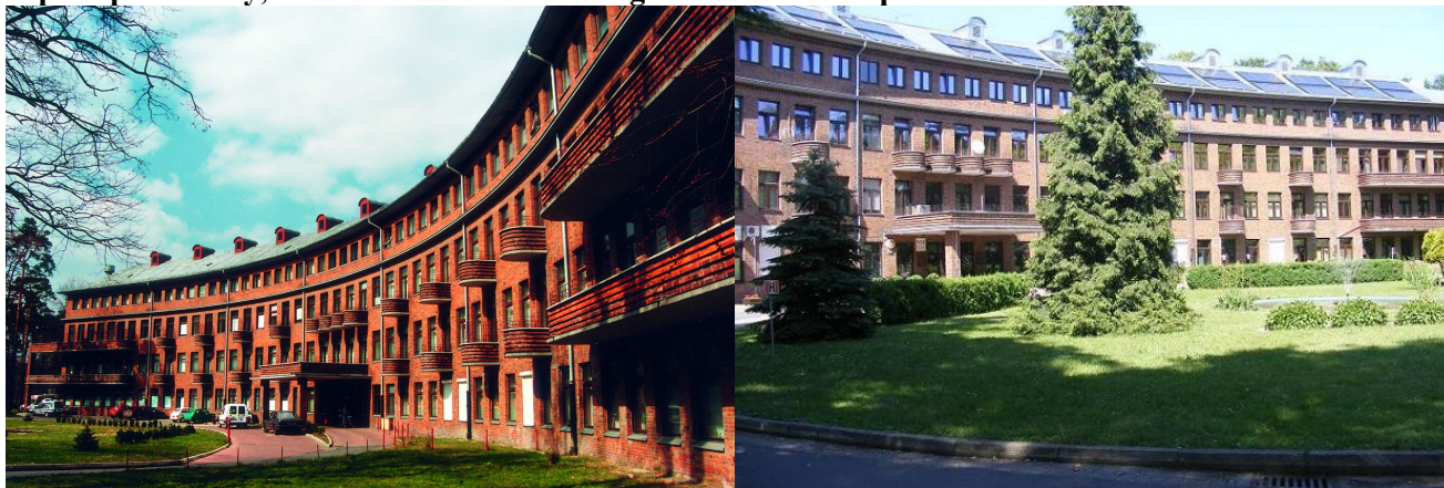
Zdjęcia nr 29, 30. Szpital powiatowy, im. Prałata J. Głowatzkiego w Strzelcach Opolskich

Modernistyczny ceglany budynek wzniesiony w 1930 r. na planie łuku, czterokondygnacyjny, nakryty dwuspadowo, rozczłonkowany gęsto rozmieszczonymi oknami i zaoblonymi balkonami. Budynek po remoncie - w latach 2007 - 2013 przeprowadzono termomodernizację.