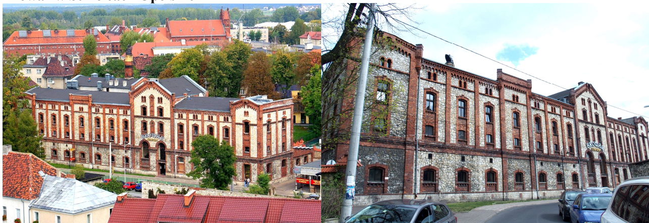
Zdjęcia nr 39, 40. Browar w Strzelcach Opolskich, źródło: Urząd Miejski w Strzelcach Opolskich