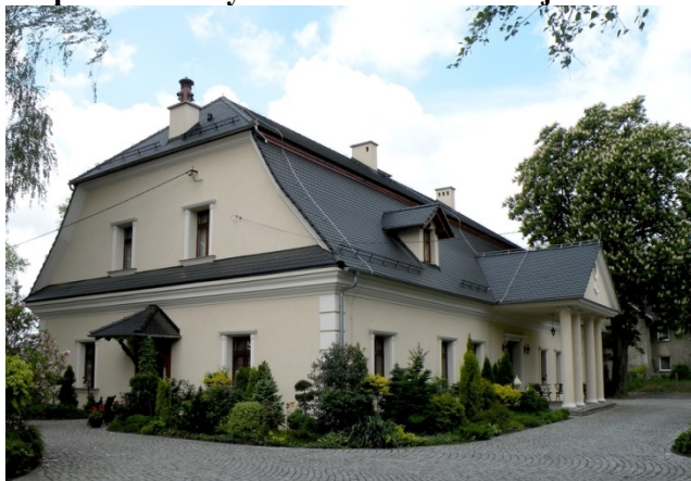
Zdjęcie nr 7. Dwór w zespole zabudowy dworsko - folwarcznej w Rozmierce

Klasykistyczny dworek wzniesiony ok. 1800 r. w płn. części wsi. Wzniesiony na rzucie prostokąta, nakryty wysokim dachem mansardowym z naczółkami. Fasada siedmioosiowa, z centralnie umieszczonym drewnianym, ob. otynkowanym portykiem kolumnowym, nad którym znajduje się trójkątny szczyt. Elewacje bez podziałów, boniowane w narożach. Układ wnętrz dwutraktowy z sienią nakrytą kolebką - na osi. W pozostałych pomieszczeniach - sufity, część z fasetą. W wejściu zachowane drzwi klasycystyczne z dekoracją rozetową. Obecnie dwór jest własnością prywatną, po remoncie.