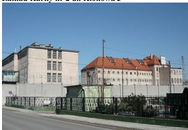
Zdjęcie nr 26. Zakład Karny nr 2 ul. Klonowa 3 w Strzelcach Opolskich

Zakład Karny nr 2 (lata 1893 - 1896) składa się z dwóch pawilonów więziennych i kuchni otoczonych murem więziennym oraz współczesnego budynku. Oba zespoły są w dobrym stanie technicznym.