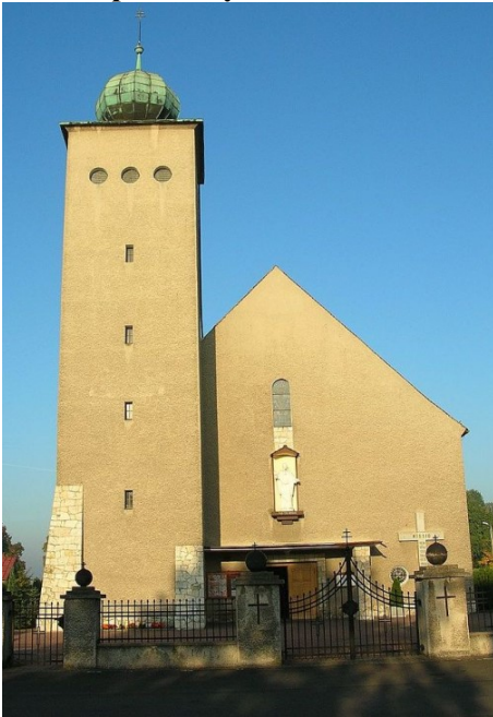
Zdjęcie nr 20. Kościół pw. Chrystusa Króla w Kadłubie

Wzniesiony w 1934 r. wg projektu Kehlera. Budynek na rzucie prostokąta, jednonawowy z węższym, prosto zamkniętym prezbiterium i wieżą zwieńczoną pękatym hełmem, umieszczoną w pld. narożu fasady. Budynek murowany, tynkowany, w narożu wieży - kamienna szkarpa. Bryła prosta, bez dekoracji, z regularnie rozmieszczonymi otworami okien. Cennym zabytkiem są organy firmy SCHLAG & SÖHNE z 1903 r. sprowadzone ze Świdnicy.