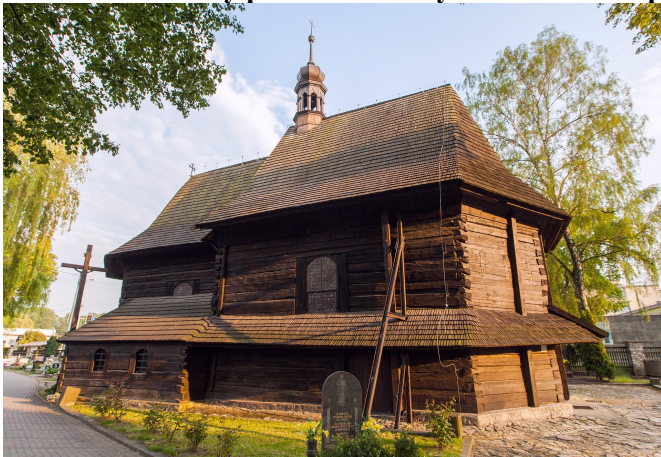
Zdjęcie nr 13. Kościół cmentarny pw. św. Barbary w Strzelcach Opolskich