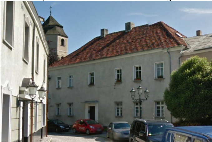
Zdjęcie nr 35. Kamienica, ul. Parafialna 2 w Strzelcach Opolskich

Starszy budynek to kamienica narożna ul. Parafialna 2, dawna plebania, z k. XVIII w. Wolnostojący, z późniejszą przybudówką przy krótszym boku, na rzucie prostokąta, dwutraktowy z sienią ze schodami, sklepioną kolebkowo - na osi, dwukondygnacyjny, nakryty czterospadowym dachem.