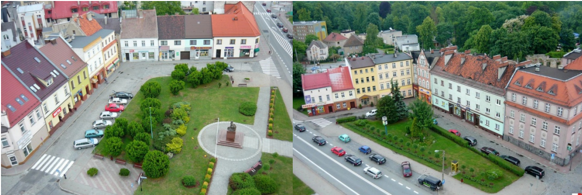
Zdjęcie nr 33, 34. Płn. - wsch. strona Rynku, między ul. Krakowską i Wojska Polskiego; Płd. - wsch. część Rynku, między ulicami Zamkową i Wojska Polskiego

Wśród zabytków nieruchomości najliczniejsze są budynki mieszkalne miejskie reprezentowane przez wille i kamienice. Część została wpisana do rejestru zabytków. Są to głównie budynki ulokowane w obrębie XIX - wiecznej zabudowy centrum miasta. Większość z nich powstała na przestrzeni XIX w. i prezentują walory typowe dla budownictwa małych miast tego okresu. Przeprowadzone remonty przywróciły im dawny blask.