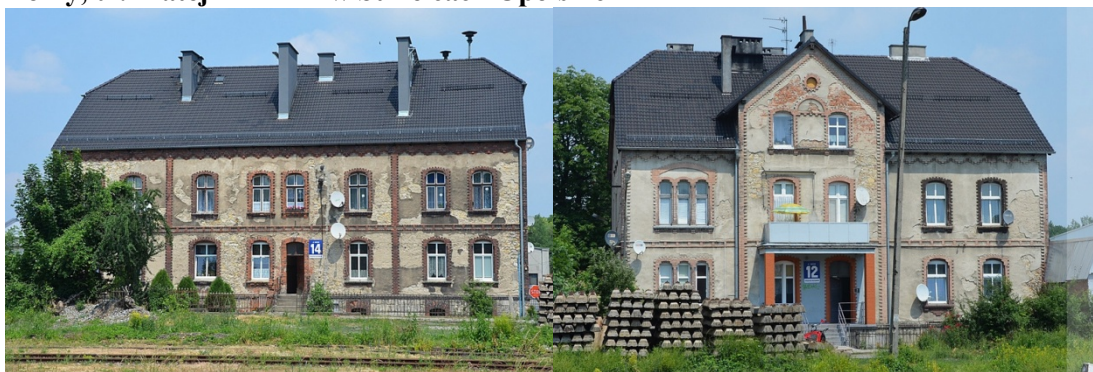
Zdjęcia nr 37, 38. Domy, ul. Matejki 12 i 14 w Strzelcach Opolskich

Mało przebudowane, z zachowanym oryginalnym detalem architektonicznym, są budynki wzniesione w stylistyce modernistycznej, powstałe w latach 20 - tych i 30 - tych XX w. - zabudowa przy ul. Matejki.