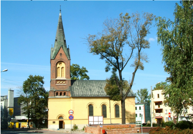
Zdjęcie nr 19. Kościół pw. Bożego Ciała w Strzelcach Opolskich

Wzniesiony jako kościół ewangelicki w latach 1825 - 1826 wg planów Ernesta Samuela Friebła. Wieża z ok. 1888 r. W 1982 r. przejęty przez katolików. Kapitałny remont kościoła prowadzono w latach 1982 - 1985.