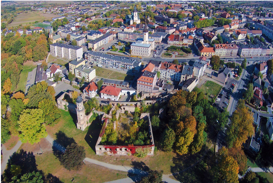
Zdjęcie nr 1. Widok z lotu ptaka układu urbanistycznego miasta Strzelce Opolskie, autor Marek Gaworski

W okresie przedlokacyjnym na terenie obecnego miasta funkcjonowały dwie jednostki: gród (wzm. 1234 r.) i leśna osada targowa Strzelce (wzm. 1271 r.). Lokacja na prawie magdeburskim (1290 r., 1305 r., 1320 r., powtórna - 1362 r.) nowego miasta nastąpiła na terenie na zach. od dawnego targowiska, na wzniesionym terenie otoczonym bagnami. Miasto otrzymało wówczas owalny, zwężający się z jednej strony kształt. Otoczone było murami obronnymi (wzm. 1327 r.) z dwiema bramami: Opolską i Krakowską i fosą. Centrum stanowił czworoboczny rynek otoczony regularnym układem ulic. Miasto oprócz zamku (wzm. 1303 r.) posiadało ratusz (1358 r.), zwarty blok zabudowy śródrynkowej, szkołę (1419 r.) i szpital pw. Ducha Świętego. W 1505 r. wzniesiono drewniany kościół pw. św. Barbary i cmentarz - poza murami. Ten stan trwał do 1 poł. XVI w.