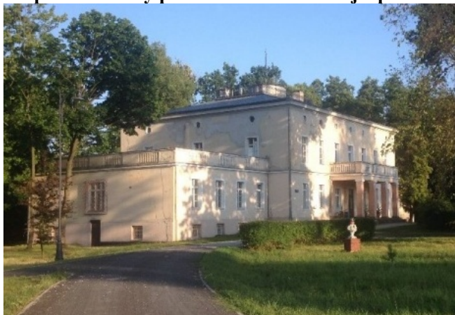
Zdjęcie nr 4. Pałac w zespole zabudowy pałacowo - folwarcznej z parkiem w Błotnicy Strzeleckiej

Pałac położony w centrum wsi, w obrębie obszernego parku otoczonego murem z kamienia wapiennego, w sąsiedztwie zespołu folwarcznego. Klasycystyczny budynek wzniesiony ok. poł. XIX w.: założony na rzucie prostokąta, z dwukondygnacyjnym, siedmioosiowym korpusem i parterowymi skrzydłami zwieńczonymi tarasami z tralkowymi balustradami. Namiotowy dach korpusu zakończony jest tarasem z okrągłą wieżyczką pośrodku. Główne wejście osłonięte czterofilarowym portykiem z tarasem w zwieńczeniu; podniebie zdobione sztukateriami. We wnętrzu zachował się układ wnętrz i część wyposażenia. Stan