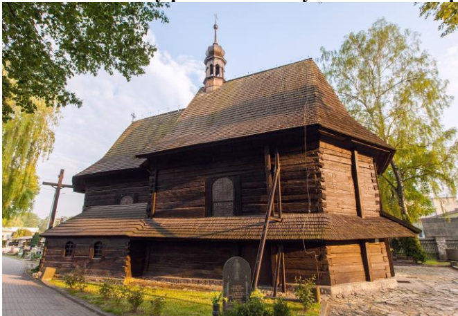
Zdjęcie nr 13. Kościół cmentarny pw. św. Barbary w Strzelcach Opolskich

Kościół wzmiankowany w 1505 r., odbudowany lub odnowiony w latach 1683 - 1690 przez cieślę Jana Brychcego z fundacji Floriana i Fryderyka Weisera; ponownie odnowiony w 1720 r. oraz w 1970 r. Drewniany, orientowany, o konstrukcji zrębowej.