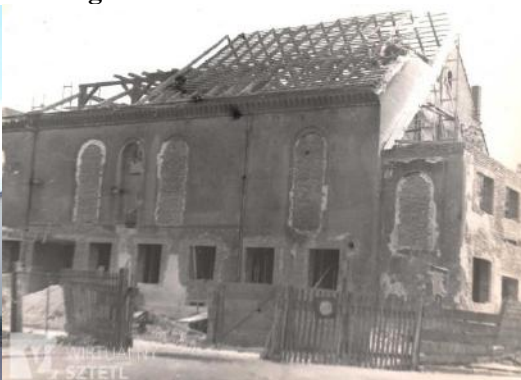
Zdjęcie nr 22, 23. Synagoga w Strzelcach Opolskich, Plac Żeromskiego 5a

Synagoga wzniesiona w 1850 r.: murowany budynek na rzucie prostokąta pierwotnie nakryty dwuspadowym dachem. Aneks ze schodami do babińca - w 1901 r. (mistrz murarski M. Hohmann). Wyposażenie zniszczono 1938 r., po wojnie urządzono w budynku magazyn rolno - spożywczy, w 1976 r. - salę sportową. Przebudowy całkowicie zatępiły dawny wygląd bożnicy. Budynek stracił walory zabytkowe. Społeczność żydowska w historii miasta odegrała istotną rolę w okresie od 1 poł. XVIII w. do 1920 r. Żydzi angażowali się w życie publiczne i towarzyskie miasta, byli wybierani do rady miejskiej. Oprócz synagogi w 2 poł. XIX w. istniała w mieście szkoła żydowska, działała biblioteka, działało w niej wiele stowarzyszeń.