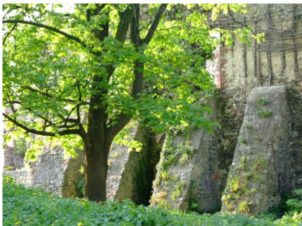
Zdjęcie nr 31, 32. Mury obronne w Strzelcach Opolskich