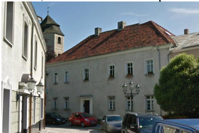
Zdjęcie nr 35. Kamienica, ul. Parafialna 2 w Strzelcach Opolskich

Starszy budynek to kamienica narożna ul. Parafialna 2, dawna plebania, z k. XVIII w. Wolnostojący, z późniejszą przybudówką przy krótszym boku, na rzucie prostokąta, dwutraktowy z sienią ze schodami, sklepioną kolebkowo - na osi, dwukondygnacyjny, nakryty czterospadowym dachem.