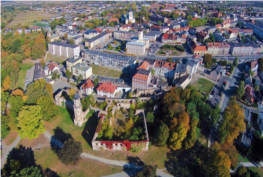
Zdjęcie nr 1. Widok z lotu ptaka układu urbanistycznego miasta Strzelce Opolskie, autor Marek Gaworski

W okresie przedlokacyjnym na terenie obecnego miasta funkcjonowały dwie jednostki: gród (wzm. 1234 r.) i leśna osada targowa Strzelce (wzm. 1271 r.). Lokacja na prawie magdeburskim (1290 r., 1305 r., 1320 r., powtórna - 1362 r.) nowego miasta nastąpiła na terenie na zach. od dawnego targowiska, na wzniesionym terenie otoczonym bagnami. Miasto otrzymało wówczas owalny, zwężający się z jednej strony kształt. Otoczone było murami obronnymi (wzm. 1327 r.) z dwiema bramami: Opolską i Krakowską i fosą. Centrum stanowił czworoboczny rynek otoczony regularnym układem ulic. Miasto oprócz zamku (wzm. 1303 r.) posiadało ratusz (1358 r.), zwarty blok zabudowy śródmiejowej, szkołę (1419 r.) i szpital pw. Ducha Świętego. W 1505 r. wzniesiono drewniany kościół pw. św. Barbary i cmentarz - poza murami. Ten stan trwał do 1 poł. XVI w.