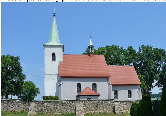
Zdjęcie nr 9. Kościół parafialny pw. św. Stanisława i Nawiedzenia NMP w Płużnicy Wielkiej

Najbardziej archaiczne cechy stylowe zachował późnogotycki kościół w Płużnicy Wielkiej. Zbudowany zapewne w XVI w., z wieżą XVIII/XIX w. Otoczony jest murem z kamienia łamanego, zapewne z czasów pierwszego kościoła (wzm. 1335 r.). Jednonawowy z węższym, prosto zamkniętym prezbiterium, oszkarpowany w narożach, z późniejszą wieżą w fasadzie. Na dwuspadowym dachu nawy sygnaturka.