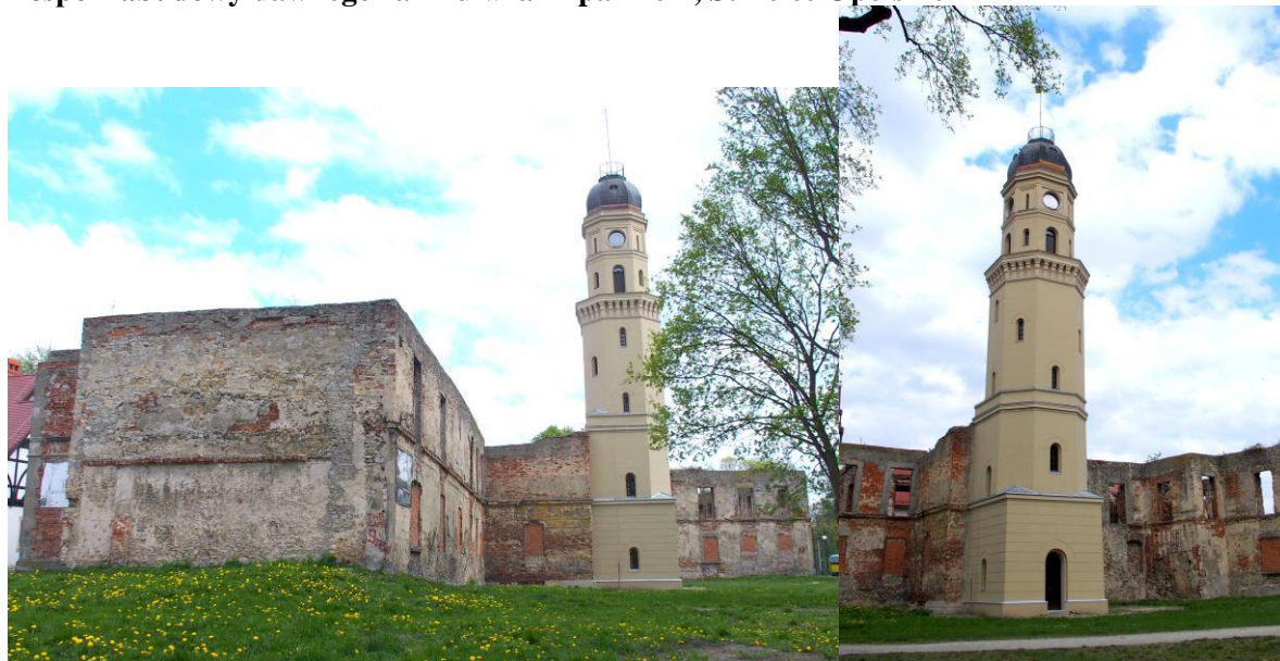
Zdjęcie nr 2, 3. Zespół zabudowy dawnego zamku wraz z parkiem, Strzelce Opolskie

Zamek wzniesiony w miejscu lokalizacji grodu wzmiankowanego w 1303 r. książąt opolskich w pocz. XIV w., wzmiankowany w latach 1324 - 1356: niezbyt rozległe założenie otoczone fosą z wieżą mieszkalną z wapienia. W czasie istnienia księstwa strzeleckiego zamek był rezydencją władcy, przebudowany w XV w. W kolejnych latach przekształcony w rezydencję, którą władały kolejno rody Hohenzollernów (w latach 1562 - 1595 przebudowali warownię na renesansowy pałac), Redern, Collona, Promnitz. Ostatnia przebudowa - w poł. XIX w. przeprowadzona przez hr. Renarda - zlikwidowała pierwotne cechy stylowe budowli. Była to budowla trójskrzydłowa z dziedzińcem, murowana z kamienia i cegły, otynkowana. Pośrodku budowli znajdował się dziedziniec. Późnoklasykistyczna brama wjazdowa pochodzi z 2 poł. XIX w., park założony został w 1832 r. Podczas II wojny światowej zamek został zniszczony. Resztki pierwotnego XIV - wiecznego zamku znajdują się w obecnych ruinach budynku bramnego.