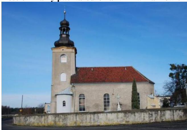
Zdjęcie nr 10. Kościół filialny pw. Narodzenia NMP w Kalinowie

Zbudowany w XV w., przebudowany w XVIII w., odnawiany w 1935 r. Jednonawowy, z trójbocznie zamkniętym nie wyodrębnionym z bryły budynku oszkarpowanym prezbiterium i kwadratową wieżą w fasadzie, z cylindrycznym aneksem klatki schodowej - od pld. Gotycka bryła zakłócona została przez znaczne poszerzenie nawy w kierunku płu., modernizację górnych kondygnacji wieży w duchu baroku oraz zmianę kształtu otworów.