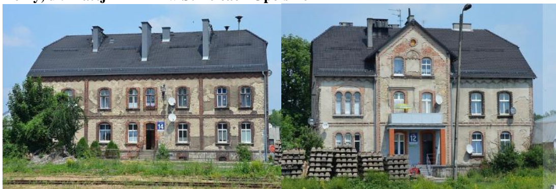
Zdjęcia nr 37, 38. Domy, ul. Matejki 12 i 14 w Strzelcach Opolskich

Mało przebudowane, z zachowanym oryginalnym detalem architektonicznym, są budynki wzniesione w stylistyce modernistycznej, powstałe w latach 20 - tych i 30 - tych XX w. - zabudowa przy ul. Matejki.