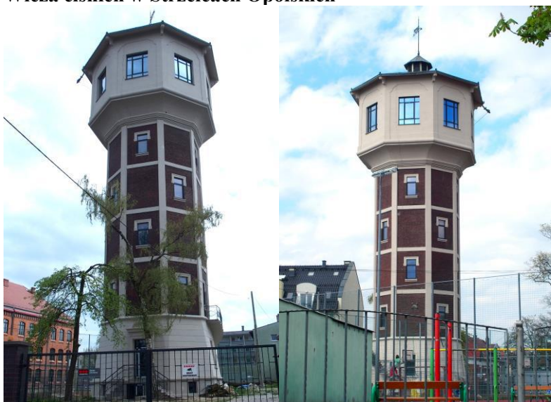
Zdjęcia nr 42,43. Wieża ciśnień w Strzelcach Opolskich