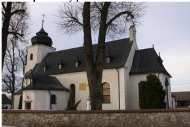
Zdjęcie nr 12. Kościół parafialny pw. św. Michała Archanioła w Rozmierzy

Zbudowany w XV w., powiększony w XVIII w., rozbudowany w 1900 r. Kościół jednonawowy, z węższym i niższym prezbiterium, z wieżą w fasadzie zwieńczonej splotami wolutowymi oraz z aneksami zakrystii i kruchty pld. Z XV - wiecznego kościoła zachowane częściowo mury nawy i zakrystii oraz wieża od zach. Obecny wygląd kościoła zawdzięcza barokowej przebudowie.