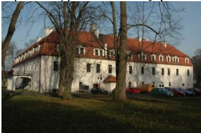
Zdjęcie nr 5. Pałac w zespole zabudowy pałacowo - folwarcznej z parkiem w Szymiszowie

Wczesnobarokowy pałac został wzniesiony ok. poł. XVII w., częściowo przebudowany po zniszczeniach w 1921 r., 1945 r. i adaptacji na Dom Pomocy Społecznej. Budynek na rzucie prostokąta z kwadratowym dziedzińcem wewnętrznym, dwukondygnacyjny, nakryty dachami mansardowymi, w dolnej połaci rozcłonkowanymi gęsto rozmieszczonymi lukarnami. W 2 poł. XVIII w. zamurowano krużganki od strony dziedzińca. Wejście główne poprzedzone czterofilarowym portykiem z tarasem w zwieńczeniu. Wewnątrz przelotowa sień kryta sklepieniem krzyżowo - żebrowym. Elewacje o prostej dekoracji, wokół okien stiukowe opaski, narożniki budynku boniowane.