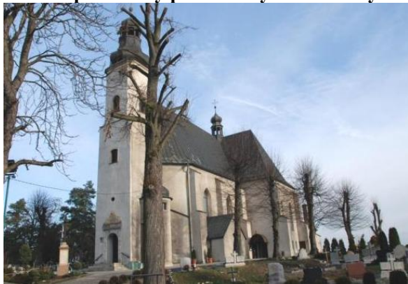
Zdjęcie nr 11. Kościół parafialny pw. św. Szymona i Judy Tadeusza w Szymiszowie

Zbudowany w 1607 r. jako protestancki, powiększony w latach 1909 - 1911 r. o transept i prezbiterium z zakrystią. Jednonawowy, salowy, oszkarpowany korpus z trójbocznie zamkniętym prezbiterium nie wyodrębnionym z bryły budynku, nakryty jest dwuspadowym dachem. W fasadzie wieża zwieńczona cebulastym hełmem, z cylindryczną klatką schodową w narożu. Smukła, gotycka bryła, otwory okienne korpusu - ostrołuczne. Kamienny, arkadowy portal z szeroką opaską dekorowaną „kaboszonami”, zwieńczony rozbudowanym nadprożem z datą 1607 i tarczami herbowymi - renesansowy, podobnie jak stiukowa dekoracja sklepień nawy kaplicy i zakrystii. Elementy barokowe to ukształtowanie górnych kondygnacji wieży i sygnaturka.