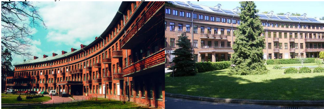
Zdjęcia nr 29, 30. Szpital powiatowy, im. Prałata J. Glowatzkiego w Strzelcach Opolskich

Modernistyczny ceglany budynek wzniesiony w 1930 r. na planie łuku, czterokondygnacyjny, nakryty dwuspadowo, rozcłonkowany gęsto rozmieszczonymi oknami i zaoblonymi balkonami. Budynek po remoncie - w latach 2007 - 2013 przeprowadzono termomodernizację.