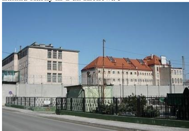
Zdjęcie nr 26. Zakład Karny nr 2 ul. Klonowa 3 w Strzelcach Opolskich

Zakład Karny nr 2 (lata 1893 - 1896) składa się z dwóch pawilonów więziennych i kuchni otoczonych murem więziennym oraz współczesnego budynku. Oba zespoły są w dobrym stanie technicznym.