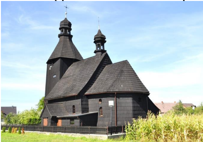
Zdjęcie nr 14. Kościół filialny pw. Nawiedzenia NMP w Szczepanku