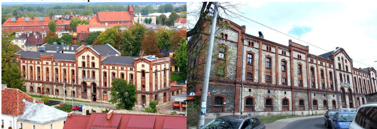
Zdjęcia nr 39, 40. Browar w Strzelcach Opolskich