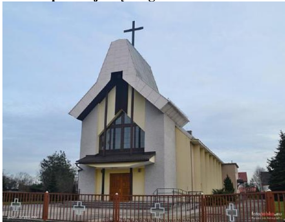
Zdjęcie nr 21. Kościół pw. Najświętszego Serca Pana Jezusa w Rozmierce

Budynek wzniesiony w latach 1980 - 1982.