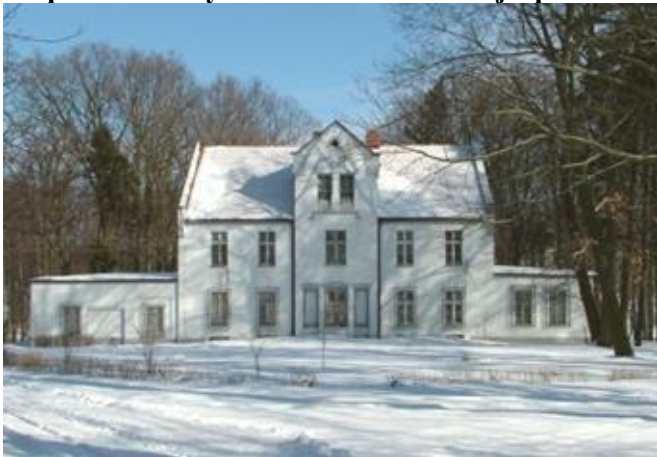
Zdjęcie nr 6. Dwór w zespole zabudowy dworsko - folwarcznej z parkiem w Płużnicy Wielkiej

Dwór wzniesiony w 1 poł. XIX w., po II wojnie światowej użytkowany jako mieszkania pracowników PGR - u zlokalizowanego na terenie folwarku. Obecnie zabytek jest własnością prywatną. Budynek dworu wzniesiony jest na rzucie prostokąta, dwukondygnacyjny z trójkondygnacyjnymi ryzalitami - na osi elewacji dłuższych, z dwoma parterowymi skrzydłami. Korpus nakryty dachem dwuspadowym, skrzydła nakryte płasko. Budynek po remoncie częściowo zmieniającym układ otworów okiennych. Zachowane taśmowe opaski okienne.