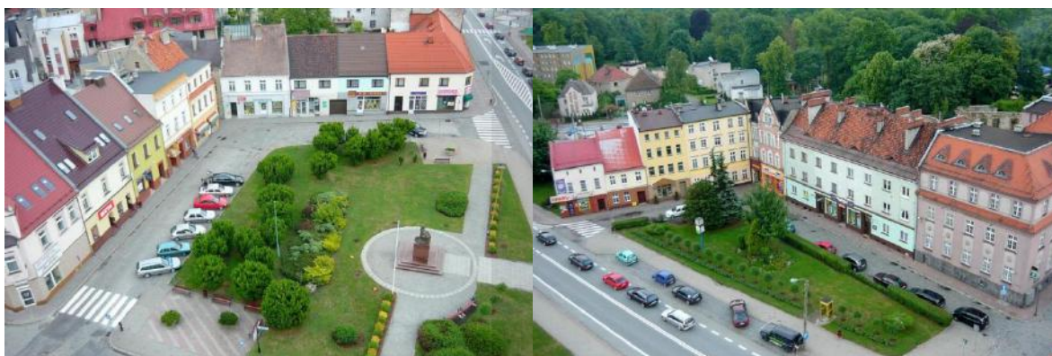
Zdjęcie nr 33, 34. Pln. - wsch. strona Rynku, między ul. Krakowską i Wojska Polskiego; Płd. - wsch. część Rynku, między ulicami Zamkową i Wojska Polskiego

Wśród zabytków nieruchomości najliczniejsze są budynki mieszkalne miejskie reprezentowane przez wille i kamienice. Część została wpisana do rejestru zabytków. Są to głównie budynki ulokowane w obrębie XIX - wiecznej zabudowy centrum miasta. Większość z nich powstała na przestrzeni XIX w. i prezentują walory typowe dla budownictwa małych miast tego okresu. Przeprowadzone remonty przywróciły im dawny blask.