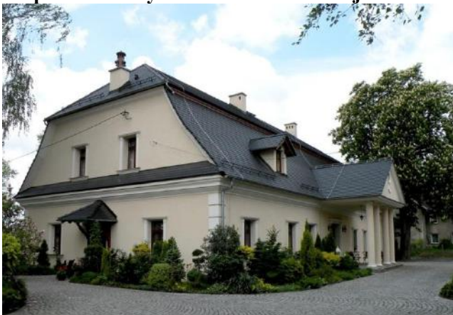
Zdjęcie nr 7. Dwór w zespole zabudowy dworsko - folwarcznej w Rozmierce

Klasycystyczny dworek wzniesiony ok. 1800 r. w płn. części wsi. Wzniesiony na rzucie prostokąta, nakryty wysokim dachem mansardowym z naczółkami. Fasada siedmioosiowa, z centralnie umieszczonym drewnianym, ob. otynkowanym portykiem kolumnowym, nad którym znajduje się trójkątny szczyt. Elewacje bez podziałów, boniowane w narożach. Układ wnętrz dwutraktowy z sienią nakrytą kolebką - na osi. W pozostałych pomieszczeniach - sufity, część z fasetą. W wejściu zachowane drzwi klasycystyczne z dekoracją rozetową. Obecnie dwór jest własnością prywatną, po remoncie.