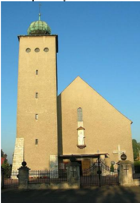
Zdjęcie nr 20. Kościół pw. Chrystusa Króla w Kadłubie

Wzniesiony w 1934 r. wg projektu Kehrer. Budynek na rzucie prostokąta, jednonawowy z węższym, prosto zamkniętym prezbiterium i wieżą zwieńczoną pękatym hełmem, umieszczoną w płd. narożu fasady. Budynek murowany, tynkowany, w narożu wieży - kamienna szkarpa. Bryła prosta, bez dekoracji, z regularnie rozmieszczonymi otworami okien. Cennym zabytkiem są organy firmy SCHLAG & SÖHNE z 1903 r. sprowadzone ze Świdnicy.