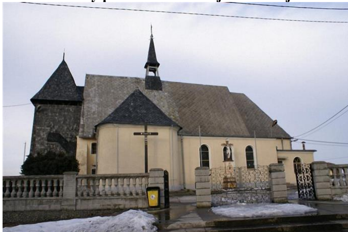
Zdjęcie nr 17. Kościół filialny pw. św. Bartłomieja w Suchej

Zbudowany w XVI w., odnowiony w 1682r., przebudowany 1820 r. przez arch. Ernesta Samuela Friebla. Rozbudowany 1959 r. Z dawnego kościoła zachowane częściowo ściany nawy, z dwiema półkolistymi, barokowymi kaplicami od pñ. i pñd. oraz kwadratowa wieża.