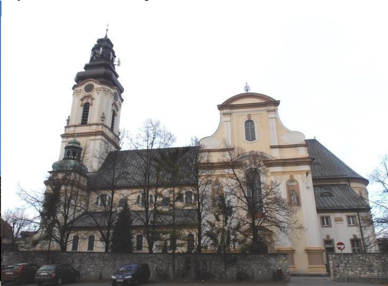
Zdjęcia nr 15, 16. Kościół parafialny pw. św. Wawrzyńca w Strzelcach Opolskich