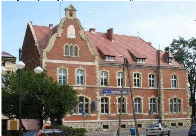
Zdjęcie nr 28. Budynek poczty, ul. Marka Prawego w Strzelcach Opolskich

Jest to ceglany budynek. Dwukondygnacyjny, na rzucie prostokąta, z fasadą rozczłonkowaną dwoma płytkimi ryzalitami - w osiach skrajnych; jeden z ryzalitów zwieńczony wysoką facjatą o wklęsło - wypukłym wykroju szczytu. Ściany ceglane, cokół kamienny, detal - w tynku: boniowanie naroży, opaski okienne.