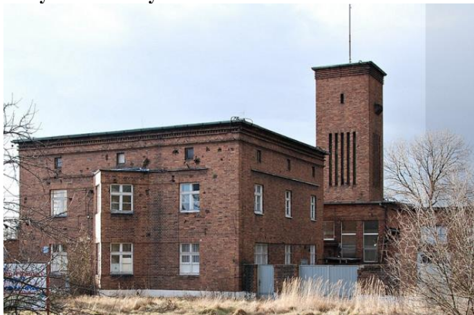
Zdjęcie nr 41. Budynek biurowy rzeźni w Strzelcach Opolskich