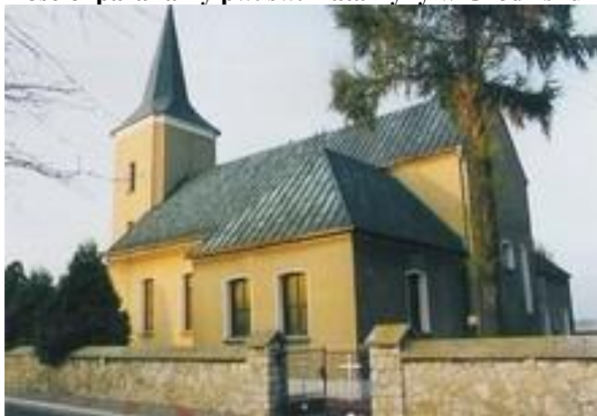
Zdjęcie nr 18. Kościół parafialny pw. św. Katarzyny w Grodzisku