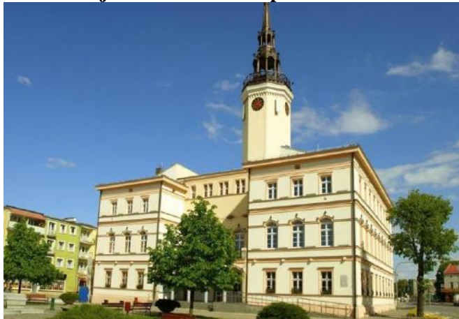
Zdjęcie nr 27. Ratusz miejski w Strzelcach Opolskich

Neogotycki budynek wzniesiony w latach 1844 - 1846 na fundamentach starszej budowli, spalonej w 1827 r. Z wcześniejszego budynku pochodzi wtopiona w tylną elewację wieża z XVI w. - w dolnej kondygnacji na planie kwadratu, wyżej o przekroju ośmiobocznym, zwieńczona fryzem i nakryta hełmem. Wzniesiony na rzucie prostokąta z prostokątnymi skrzydłami - w bocznych osiach elewacji. Między skrzydłami - neogotycki portyk zwieńczony tarasem. Elewacje rozczłonowane regularnie z gęsto rozmieszczonymi oknami i wyrazistymi podziałami gzymsowymi.