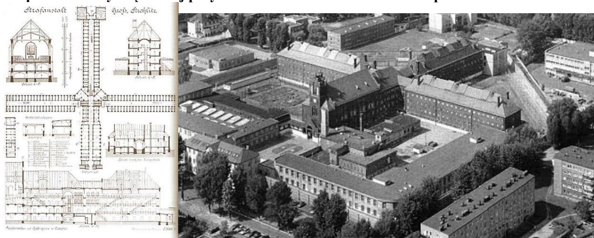
Zdjęcie nr 24, 25. Zespół zabudowy więziennej przy ul. Karola Miarki w Strzelcach Opolskich

Jednym z ciekawszych architektonicznie zespołów więziennych w województwie jest Zakład Karny nr 1 w Strzelcach Opolskich (lata 1885 - 1889), wzniesiony na planie krzyża równoramiennego wg projektu radcy budowlanego Endella. Po wojnie dobudowano budynki administracji i pomieszczeń gospodarczych.