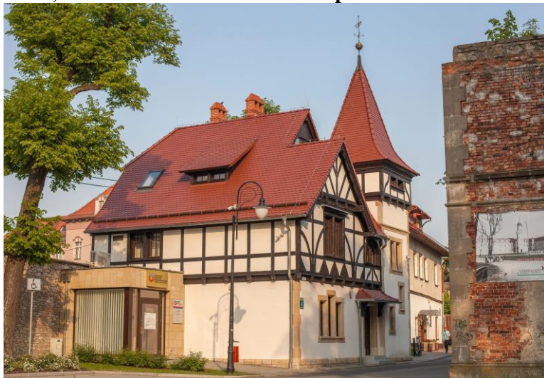
Zdjęcie nr 36. Willa, ul. Zamkowa 4 w Strzelcach Opolskich