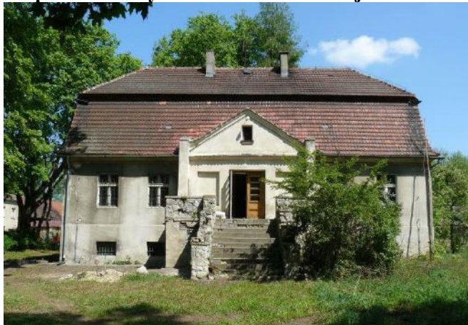
Zdjęcie nr 8. Dwór w zespole zabudowy dworsko - folwarcznej w Kadłubie, ul. Wodna 11

Wpis do rejestru zabytków dotyczy tzw. starego dworu (zameczku myśliwskiego wymienianego w 1845 r.), należącego do rodu von Strachwitz. W związku z budową nowego dworu (ul. Zamkowa 5, ob. Zespół Szkół Specjalnych przy DPS Zgromadzenia Sióstr Franciszkanek Misjonarek Maryi w Kadłubie) po drugiej stronie rzeki Jemielnica w 1930 r., budynek został przekazany nadleśnictwu, po wojnie pełniąc funkcje przedszkola. Obecnie pełni funkcje mieszkalne.