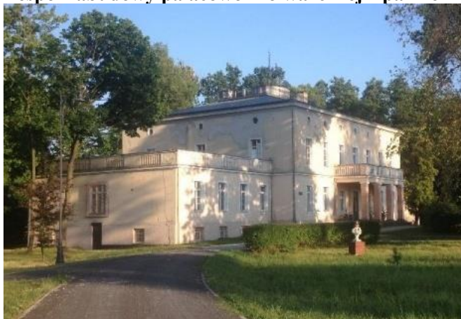
Zdjęcie nr 4. Pałac w zespole zabudowy pałacowo - folwarcznej z parkiem w Błotnicy Strzeleckiej

Pałac położony w centrum wsi, w obrębie obszernego parku otoczonego murem z kamienia wapiennego, w sąsiedztwie zespołu folwarcznego. Klasycystyczny budynek wzniesiony ok. poł. XIX w.: założony na rzucie prostokąta, z dwukondygnacyjnym, siedmioosiowym korpusem i parterowymi skrzydłami zwieńczonymi tarasami z tralkowymi balustradami. Namiotowy dach korpusu zakończony jest tarasem z okrągłą wieżyczką pośrodku. Główne wejście osłonięte czterofilarowym portykiem z tarasem w zwieńczeniu; podniebie zdobione sztukateriami. We wnętrzu zachował się układ wnętrz i część wyposażenia. Stan